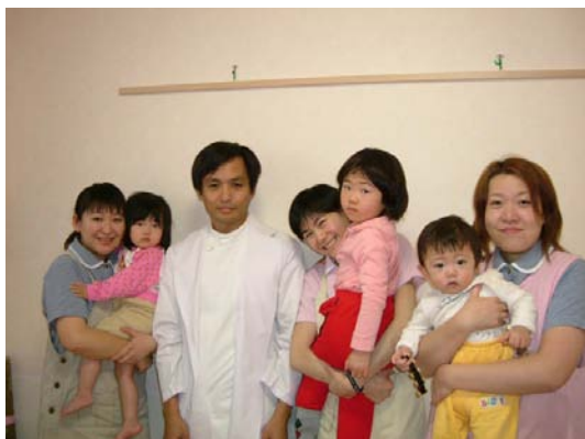
ことりの森のスタッフのみなさん

このような嬉しい言葉に感謝し大切に、これからも皆様と共に保育看護の質の向上を目指し頑張っていきたいと思っておりますので、どうぞ宜しくお願い致します。